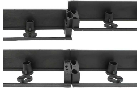
Système de jonction rapide