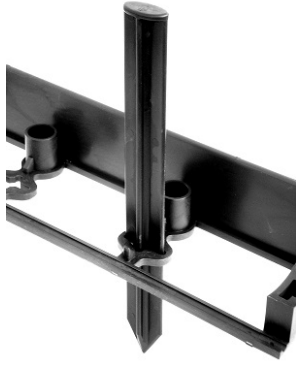
Positionnement du pieu