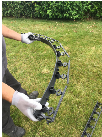
Préparation rapide d'une forme courbe en découpant les renforts à la simple pince coupante