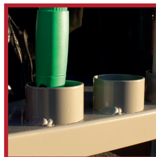
Outils maintenus à la base