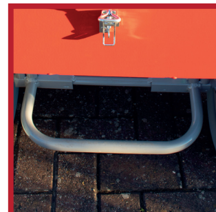
Ergot de levage