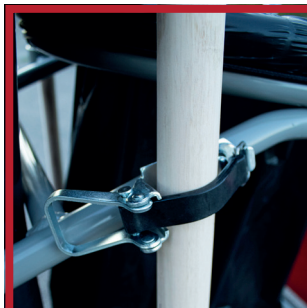
Clip spécifique pour la pelle