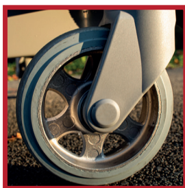
Roue avant robuste multidirectionnelle