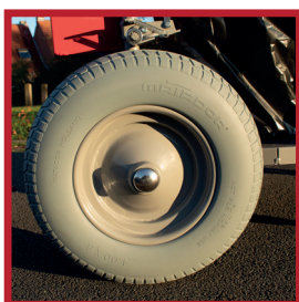
Roue arrière increvable 40 cm