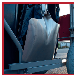
Maintien pelle tête en bas