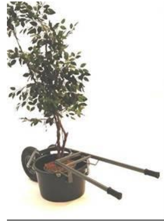
d-mise en place du seau simple et sans effort