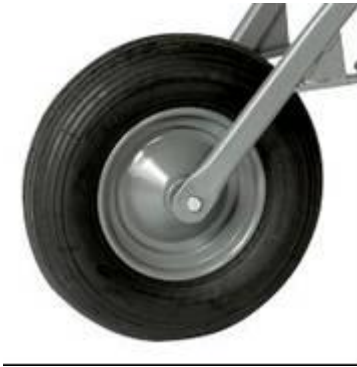
c-jantes métalliques avec double roulements à billes