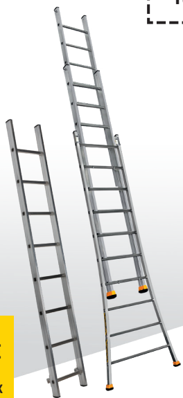
POSITION ÉCHELLE SIMPLE