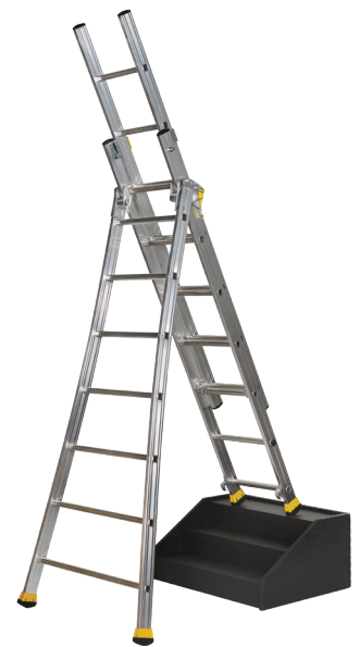
POSITION EN DÉNIVELÉS

3 ÈME PLAN DÉTACHABLE JUSQU'À 2 x 10 ET 3 x 10 BARREAUX