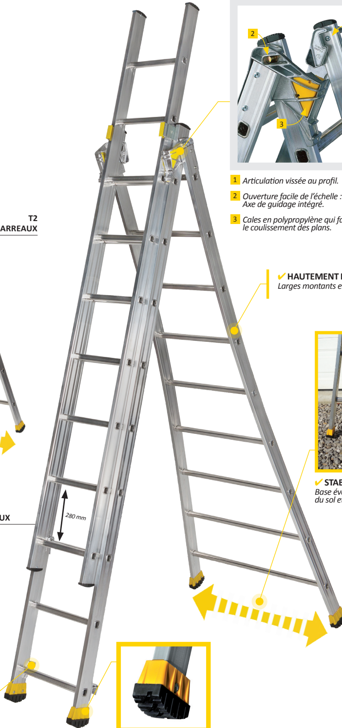
T3 3 X 9 BARREAUX

✓ STABILITÉ INCOMPARABLE ! Base évasée qui permet de contrer les irrégularités du sol et d'éviter les obstacles.