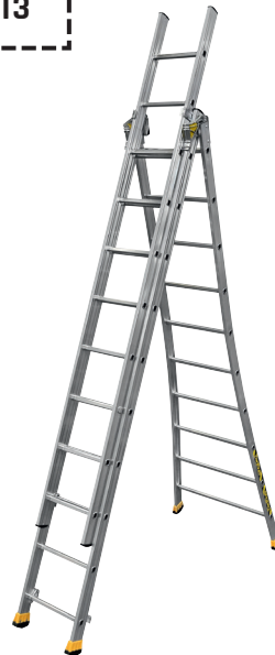
POSITION AUTOSTABLE AERIEENNE