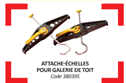
ATTACHE-ÉCHELLES POUR GALERIE DE TOIT Code 380395