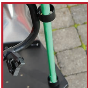
Balai solidement maintenu