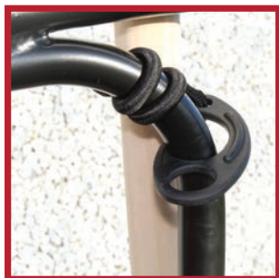
Crochet de fixation élastique pour la pelle