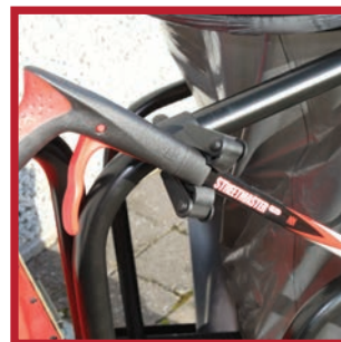
Clips spéciaux pour pinces à déchets