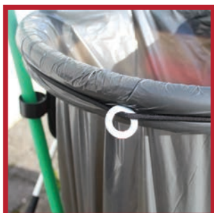
Anneau d'écartement du sandow