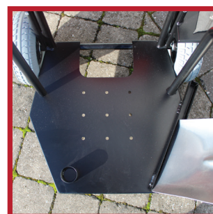
Fond perforé pour l'évacuation de l'eau