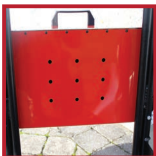
Coffret perforé permettant l'aération